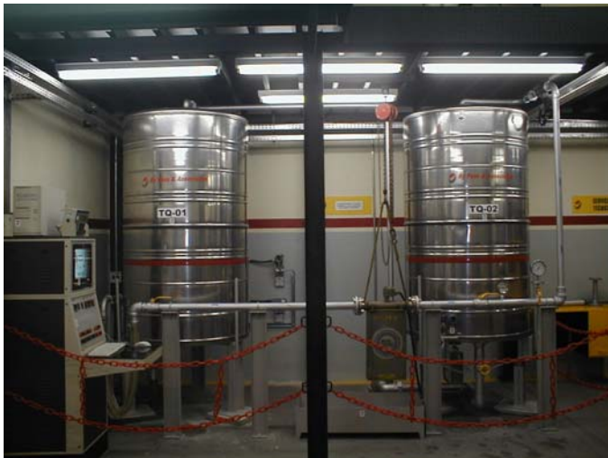
Laboratório de vazão By Pass & Associados