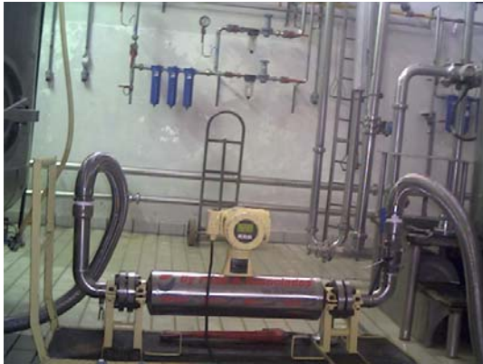
Padrão para calibração em campo- By Pass & Associados